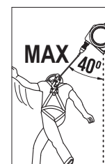
Ángulo máximo de 40° desde el eje vertical.