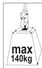
Peso Max. permitido 140 kg.